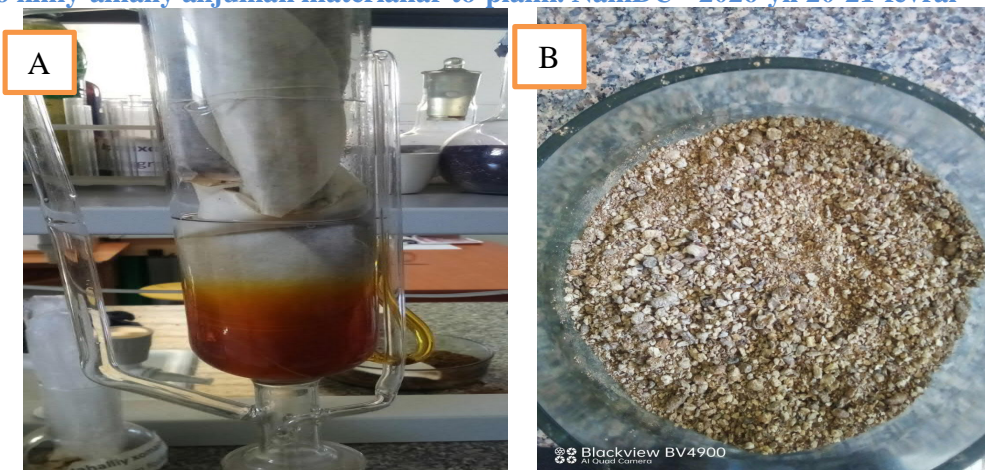
1-rasm. Sokslet ekstraksiya usuli asosida tut ipak qurti g‘umbagidan yog‘ olish jarayoni (A), yog‘i ajratib olingan tut ipak qurti g‘umbagi (B)

RE100-Pro markali haydash laboratoriya qurilmasida vakum ostida past temperaturada yog‘ erituvchidan ajratib olindi. Tut ipak qurti g‘umbagi va geksan erituvchilari ta’sirida olingan yog‘i ajratib olingan tut ipak qurti g‘umbagining sirt morfologiyasini o‘rganish uchun SEM (skanerlovchi elektron mikroskop) tahlili JEOL JSM-IT200LA firmasining uskunasi amalga oshirildi (2-rasm).